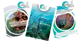
Typologies des habitats marins pour les façades Atlantique-Manche-mer du Nord, Méditerranée et pour la Martinique

◆ Les standards d'échange du SINP : cadres de saisie des jeux de données et des métadonnées associées qui s'appuient sur des ensembles de concepts et d'attributs. Le SINP met à disposition trois standards d'échange pour :